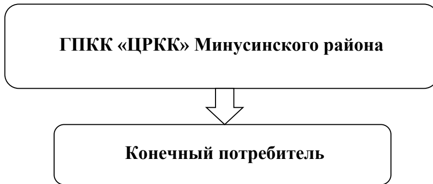
Рис.1.1 Функциональная схема централизованного водоснабжения Селиванихинского сельсовета

Функциональная схема централизованного водоснабжения Селиванихинского сельсовета представлена на рисунке.