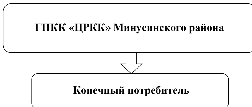
Рис.1.1 Функциональная схема централизованного водоснабжения с. Малая Минуса и п.Суходол

Основными источниками хозяйственно-питьевого, противопожарного и производственного водоснабжения потребителей населенных пунктов Маломинусинского сельсовета являются восемь артезианских скважин, из них шесть скважин действующие, две скважины резервные.